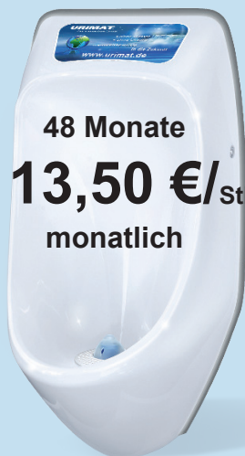
URIMAT compactplus mit passivem Werbedisplay